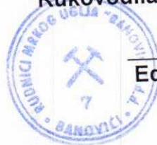
Edis Softić, dipl. ecc.

Transakcijski računi: 161 0250 007 190075 Raiffeisen bank d.d. BiH, filijala Tuzla 132 1300 309 179345 NLB Banka d.d. Tuzla, filijala Banovići 154 3602 003 310866 Intesa Sanpaolo banka d.d. BiH 555 0530 049 467130 Nova banka AD Banja Luka, ekspozit. Tuzla 102 7090 000 001366 Union bank d.d. Sarajevo